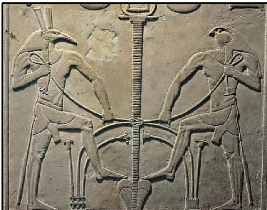
Semataui . Trono de Sesostris I (Detalle). Ca. 1974-1929 a.C. Museo Egipcio de El Cairo (JE 31139).