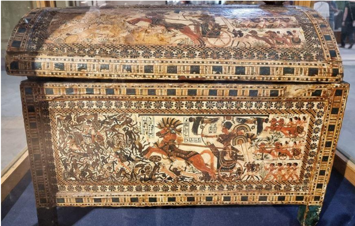
Imagen 1. Cofre pintado del ajuar de Tutanjamón (Museo del Cairo, JE 61467).