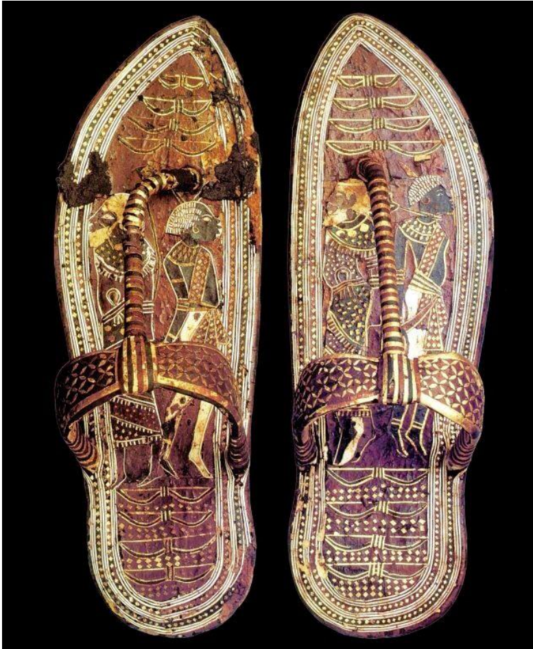
Imagen 3. Sandalias de cuero y madera (Museo del Cairo, JE 62692).