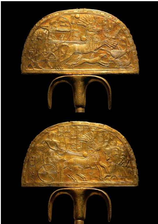
Imagen 2. Abanico con escenas de caza de avestruces (inv. Grand Egyptian Museum #284, antes JE 62001)