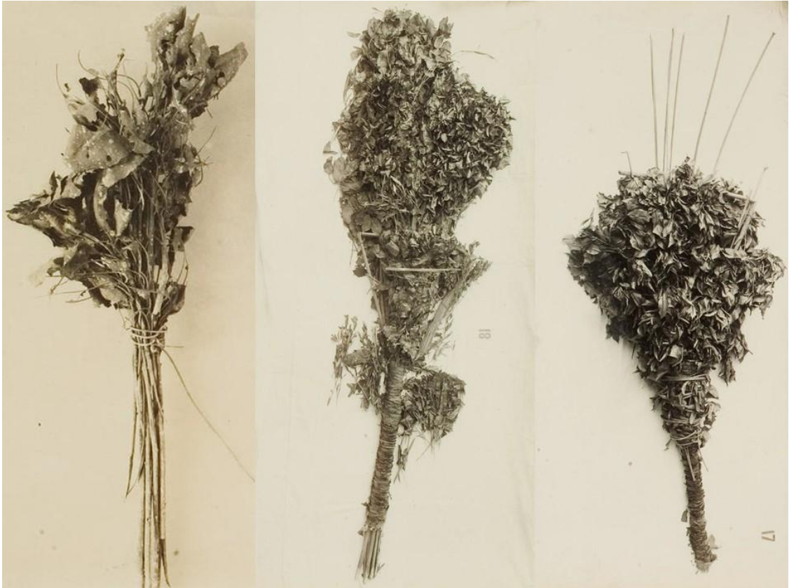
Ramos de flores procedentes de la tumba de Tutankhamon.