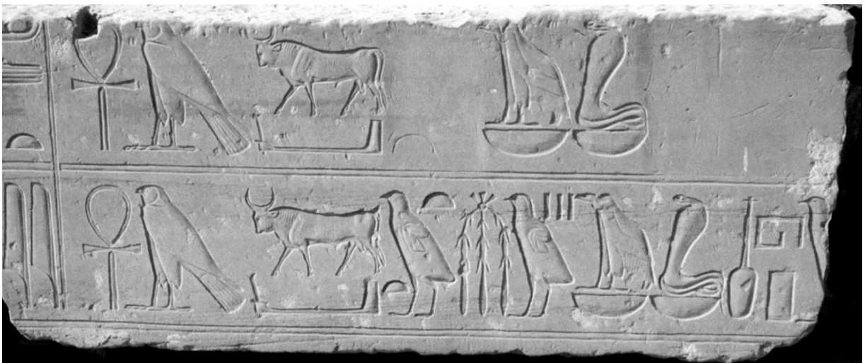
Relieve que muestra intactos los nombres de Horus y Nebty de Tutankhamon (abajo) y una damnatio memoriae aplicada a los mismos nombres en el caso de Ay (Arriba)