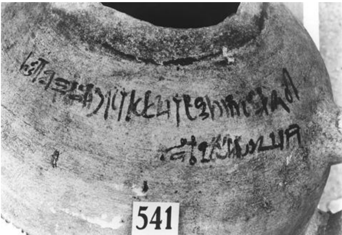
Inscripción hierática con referencia al año 9 de Tutankhamon