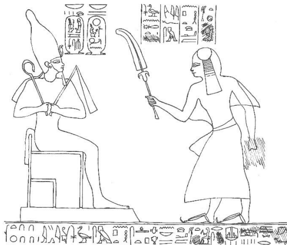
KHAEMWASET Y LOS FESTIVALES SED DE RAMSES II

La fama que obtuvo hizo que no se olvidara su memoria. Es posible que fuera objeto de un culto especial. Y en cualquier caso pasa a convertirse en héroe de una serie de relatos de magia y aventuras que fueron muy populares en el Egipto Tardío y Grecorromano. Se trata del Ciclo Demótico de Setne Khamwas (Setne I y Setne II). Reflejo de estos relatos de ficción lo encontramos en Herodoto, en tradiciones legendarias que llegan hasta el sur de Rusia y Ucrania, como sucede con otros motivos folclóricos egipcios, e incluso en la narrativa histórica contemporánea, con la excelente novela El Papiro de Saqqara .